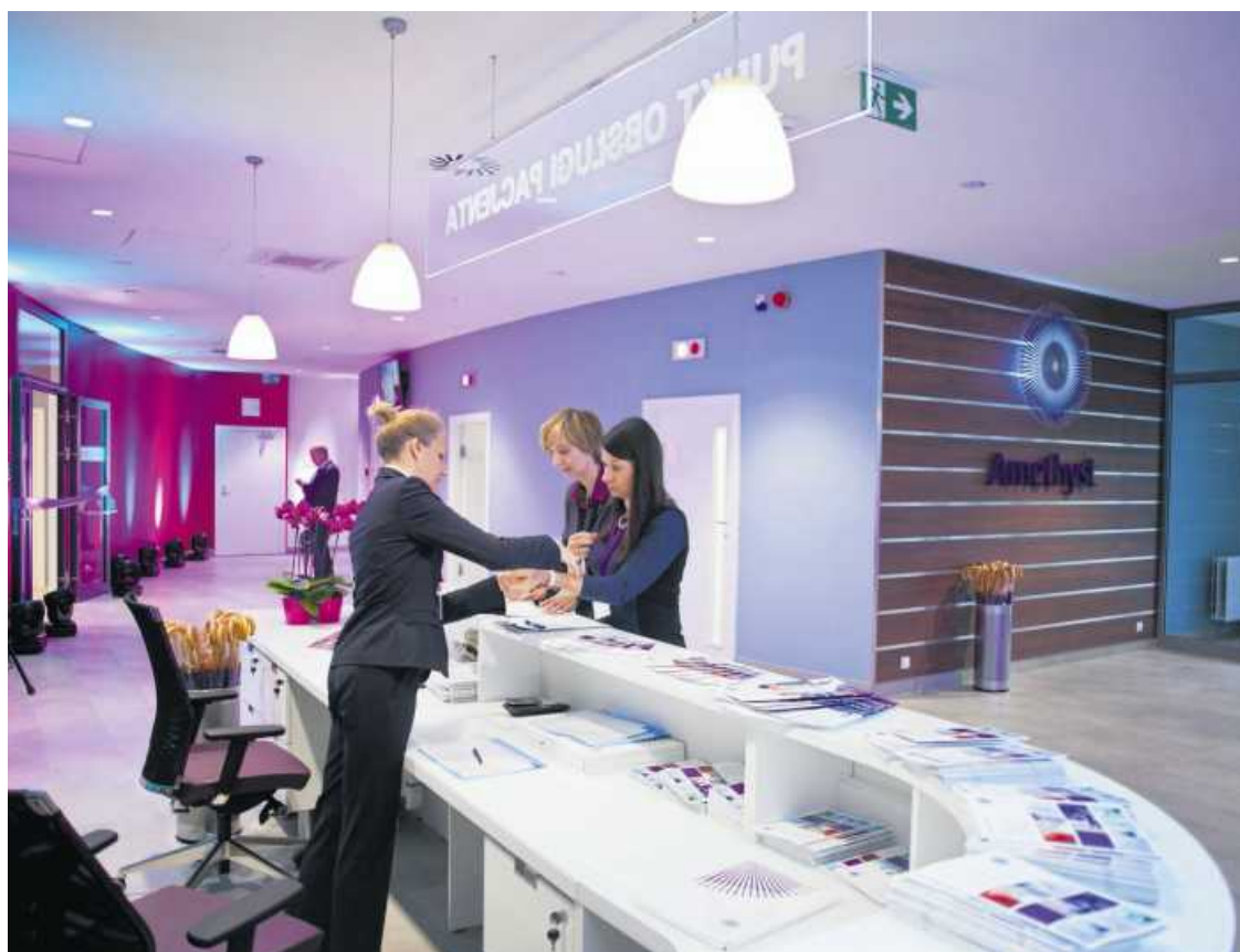
• Recepcja Centrum Radioterapii Amethyst

mniej się boją, lepiej się czują. Poradzenie sobie z trudnymi uczuciami wymaga pewnego zaufania, że ich przeżywanie nas nie zabije. Paradoksalnie akceptacja nieuchronności śmierci jako zjawiska towarzyszącego nam w każdym momencie życia może tu być bardzo pomocna. Kiedy w końcu przestaniemy umierać w sobie, zostanie jeszcze odpowiednia ilość czasu na życie. To nie choroba nam go zabiera, to my sami często tracimy go na bezproduktywne działania. A w procesie zdrowienia każda chwila zainwestowana w swój komfort, przyjemność, doświadczanie tego, czego chcę doświadczyć, jest ważna. Niezależnie od tego, ile kłopotów, trudności, spraw pojawia się obok. Wiele pacjentów pochłoniętych myśleniem o chorobie, wirusie, proporcji zachorowań do liczby zgonów w ich miejscu zamieszkania zapomina o sobie i swoich potrzebach. Nie potrafi odpowiedzieć na podstawowe dla mobilizacji zdrowienia pytania: Jak ja odpoczywam? Co mogę zrobić, by odpoczywać więcej, częściej, lepiej? I nie chodzi tu o leżenie na kanapie, ale o wypocinek, który może dać poczucie spełnienia, zadowolenia, przyjemności. Który w tak trudnym czasie choroby i sytuacji epidemii przywróci życiu zapach i smak. Czas, który mamy, jest nasz i tylko nasz. Każdy ma swoje 100 proc., ani mniej, ani więcej. Warto więc wykorzystywać go w pełni na to, co możemy dziś, tu i teraz, i z tego czerpać najlepszą dla mnie dostępną jakość życia. ●