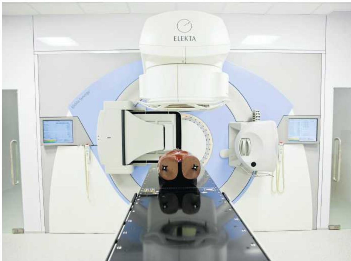
• Przyspieszacz liniowy (akcelerator) to urządzenie generujące wiązkę promieniowania wysyłaną w kierunku guza nowotworowego