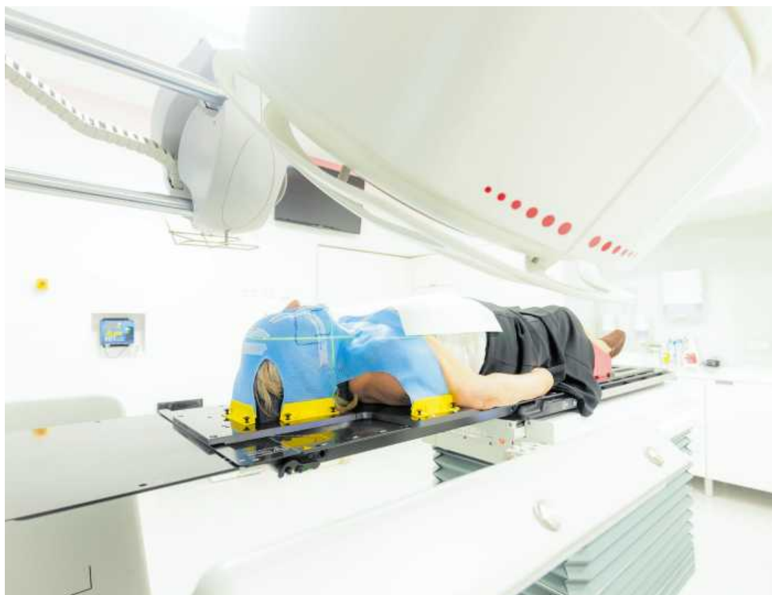
• Pacjent przygotowywany do napromieniania