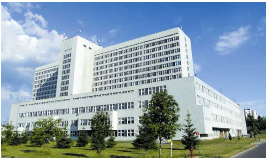
• Szpital im. Rydygiera

Radioterapia jest realizowana przez Centrum Radioterapii